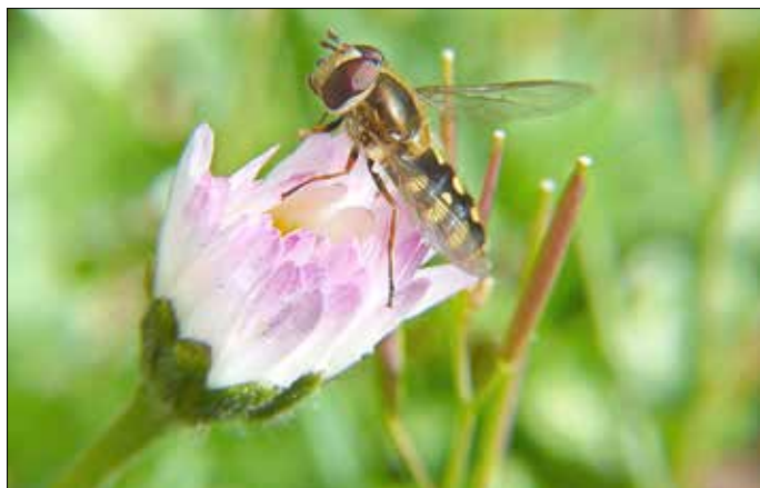
Honigbiene auf Gänseblümchen Foto: © Naturpark/VDN-Fotoportal/Udo Stamm* freie Nutzung im Kontext dieser Pressemeldung

Informationen über den Naturpark erhalten Sie bei der Naturpark-Geschäftsstelle Hermeskeil, Telefon 06503/9214-0 und info@naturpark.org .