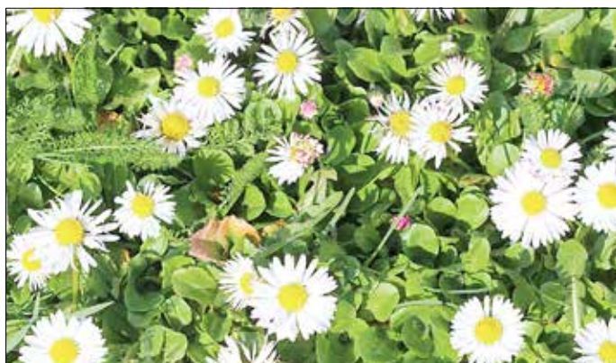
Gänseblümchen auf der Wiese, Foto: © Naturpark/VDN-Fotoportal/Re-nate Reinbothe* freie Nutzung im Kontext dieser Pressemeldung