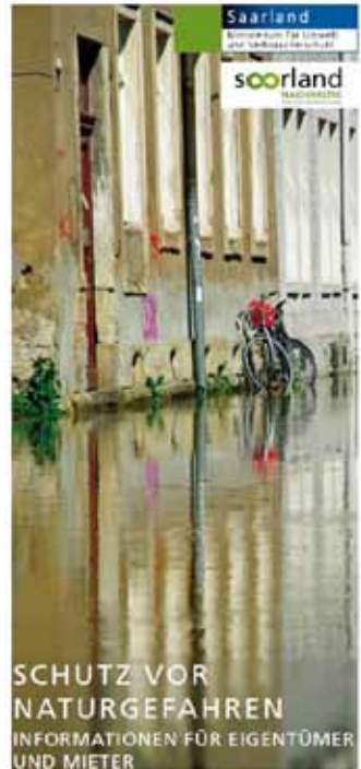
Flyer der Elementarschadens-kampagne aus dem Jahr 2015

Zusätzlich zu Maßnahmen der Bauvorsorge und Eigenvorsorge besteht die individuelle Möglichkeit, das Risiko gegen Hochwasser über entsprechende Versicherungen des Eigentums abzusichern. Eine Elementarschadensversicherung umfasst Schäden durch Hochwasser, deckt aber auch andere Risiken wie Starkregen, Erdbeben oder Schneedruck ab. Zunächst ist entscheidend, ob und wie stark Ihr Gebäude gefährdet ist. So können Sie bei Bedarf geeignete Maßnahmen zur Verminderung des Risikos einleiten. Überschwemmungen durch Flüsse und Bäche werden in Hochwassergefahrenkarten und -risikokarten dargestellt. Auf diesen Karten können Sie für Ihr Gebäude herausfinden, wie hoch das Wasser im Hochwasserfall steht. ( http://geoportal.saarland.de/portal/de/fachanwendungen/wasser.html )